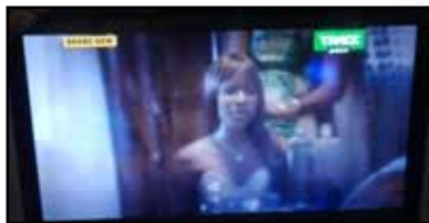
«Djobo», duo avec Mawndoé diffusé sur Trace